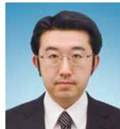
特定社会保険労務士