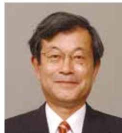
中小企業診断士・特定社会保険労務士